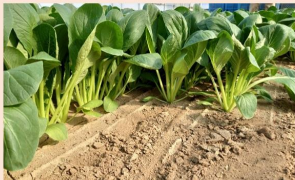
ジャミ少なく秀品率高い