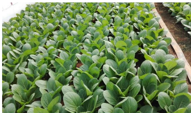
カッピング少なく形状きれい