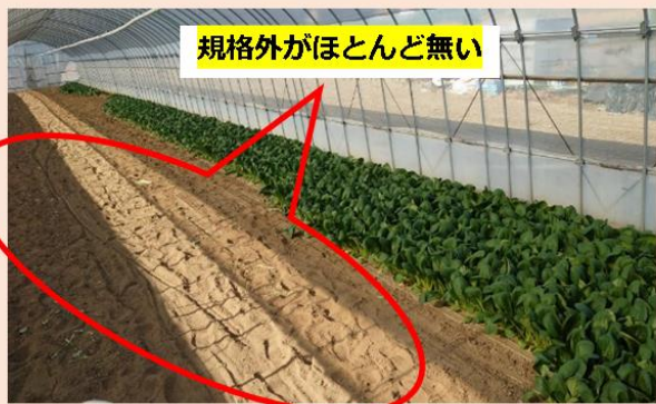
規格外がほとんど無い