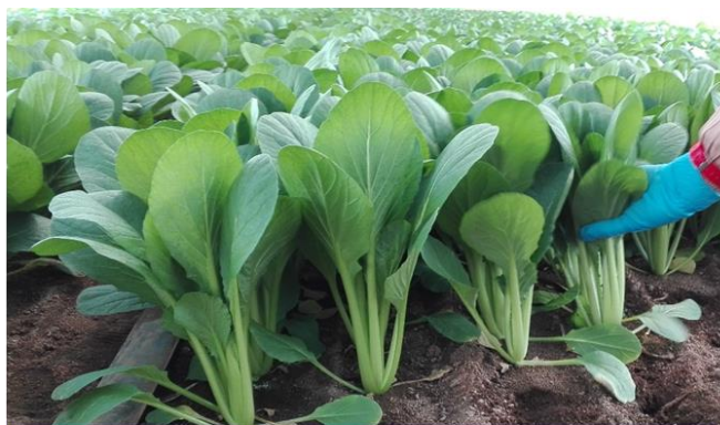
立性で絡まない! 作業性良好